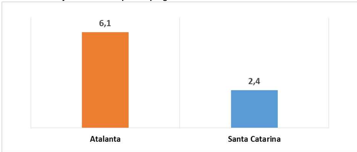
Gráfico 3 - Relação habitantes por emprego