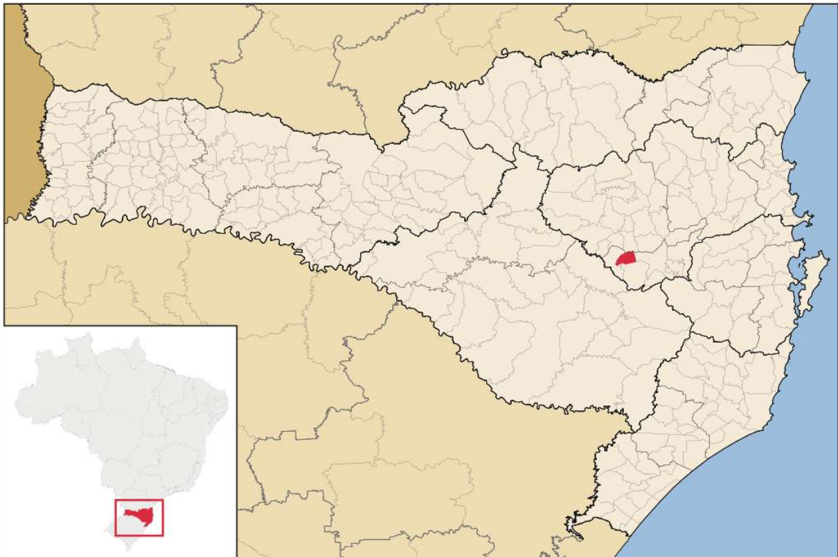
Figura 1 – Localização do município em Santa Catarina

Fundada em 1964 e colonizada por italianos e alemães, Atalanta sempre teve caráter agrícola. Aos poucos, no entanto, a exploração da terra para a agricultura foi degradando as matas ciliares, à margem dos 11km de rios do município. Em consequência, a cidade era vítima de constantes enchentes. Há 15 anos, a APREMAVI, uma organização não-governamental, conseguiu conscientizar os agricultores e moradores da cidade sobre a importância da preservação do meio ambiente. Fruto desse trabalho, foram recuperados 70% das matas nativas da cidade. Hoje, Atalanta mantém um viveiro que produz 200.000 mudas/ano de mais de 70 espécies nativas da região.